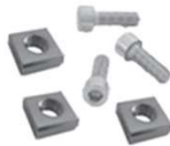
Dadi e bulloni