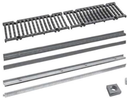
Griglia in ghisa