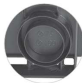
Scarichi laterali H 7,5: scarico \varnothing 63 - 75 H15: Scarico \varnothing 75 - 100