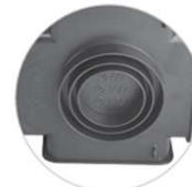
Scarichi inferiori: \varnothing 75 - 90 - 110 e \varnothing 80 - 100 - 125

Materiali ABS con Izod ad altissima resistenza