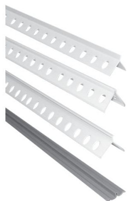
PAP26-12 Paraspigolo in plastica a lama PAP26-02 Paraspigolo in plastica testa arrotondata PAP26-14 Paraspigolo in plastica Testa a 'T' GT03-01 Guida in plastica a 'T'

Il paraspigolo in plastica con testa arrotondata, a "T" o a lama, è indicato nel proteggere e rinforzare l'intonaco degli spigoli. La guida in plastica a "T" è una valida alternativa alla versione zincata.