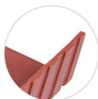
Scanalature laterali gocciolatoio