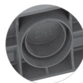
Scarichi laterali H 15: scarico Ø 80-100 e Ø 63-90-110 H 20: scarico Ø 80-100-125 e Ø 63-90-110-160