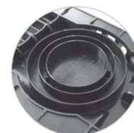
Scarico inferiore: Ø 100-110-125-160

Materiali ABS con Izod ad altissima resistenza