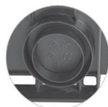
Scarichi laterali H 7,5: scarico \phi 63 - 75 H15: Scarico \phi 75 - 100