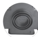
Scarichi inferiori: \phi 75 - 90 - 110 e \phi 80 - 100 - 125

Materiali ABS con Izod ad altissima resistenza