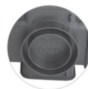
Scarico inferiore: \varnothing 75 - 100 - 110

Materiali ABS con Izod ad altissima resistenza