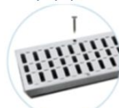
Possibilità di fissaggio anche con viti