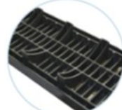
Lato inferiore griglia in polipropilene