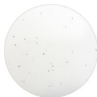
Dettaglio della finitura marmorizzata