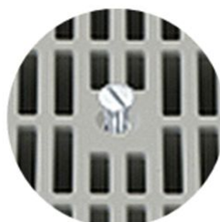
Dettaglio apertura con bullone