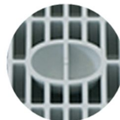
Elemento di presa della griglia