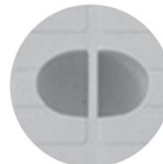
Elemento di presa del chiusino