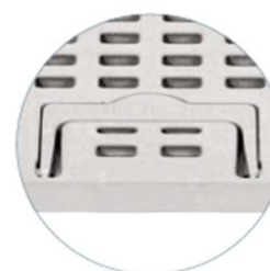
Elemento di presa della griglia