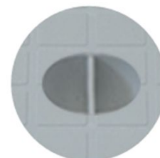
Elemento di presa del chiusino