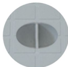
Elemento di presa del chiusino