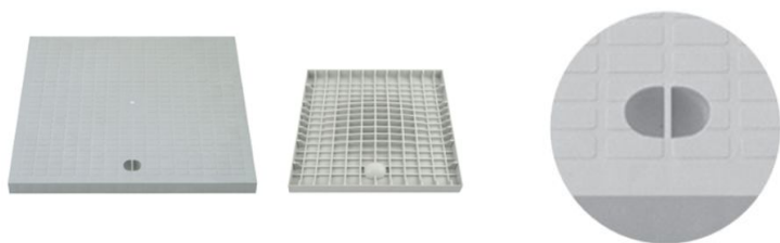
Elemento di presa del chiusino

Ha un design semplice , un' ottima resistenza agli agenti atmosferici e garantisce un ottimo rapporto qualità prezzo .