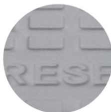
Verniciatura con polvere epossidica