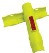
COPG-04 COPRITUBO DI SEGNALAZIONE DUE GUSCI