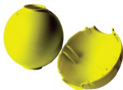
COPR-01 SFERA COPRIROSETTA PER SNODO MULTIDIREZIONALE

Ideale per coprire la rosetta dei ponteggi multidirezionali, garantendo così la massima sicurezza del pedone e dell'operatore