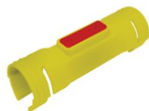
COPG-05 COPRITUBO DI SEGNALAZIONE