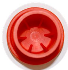
Dettaglio interno rinforzato