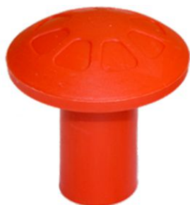
FUNGO-01 MODELLO PER TONDINO 6-20 mm

Accessorio indispensabile nella segnalazione di monconi di tondino sporgenti. Questo articolo è disponibile in quattro versioni per il mercato italiano ed estero.