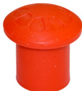
FUNGO-02 MODELLO PER TONDINO 16-32 mm