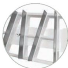
Particolare struttura rabot 12x28

Materiali Manico e base FRRAS12X28-01 in ABS Lame FRRAS12X28-01 in acciaio