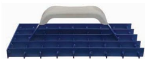
FRRAS14X28-01 Rabot 14x28 a griglia