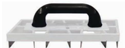
FRRAS12X28-01 Rabot 12x28 con lame lisce

Serve a uniformare superfici in cemento o gesso , si utilizza spesso per pulire il battuto in cemento o una parete precedentemente intonacata, nonché per raschiare la colla delle piastrelle indurita.