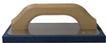
FRALL14X22-01 Frattone 14x22

Il frattone con base in alluminio e manico in legno è disponibile con spugna nei colori arancio e azzurro. E' impiegato nella stesura di intonaci tradizionali o premiscelati. "Densità media" per la gomma arancio, "densità alta" per la gomma azzurra.