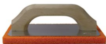
FRALL14X22-02 Frattone 14x22

Materiali Base in alluminio Manico in legno Gommapiuma