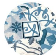
Esempio di utilizzo